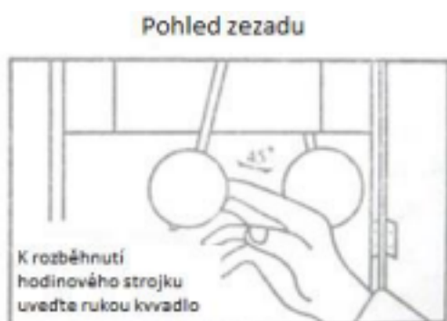
Obrázek č. 5

Az óra elindításához mozgassa az ingát a jobb vagy bal külső helyzetbe, és engedje el (lásd az 5. ábrát). Amint az inga elkezd szabályosan lendülni, az órának el kell kezdenie a szokásos módon ketyegni.