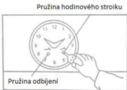
Obrázek č. 4